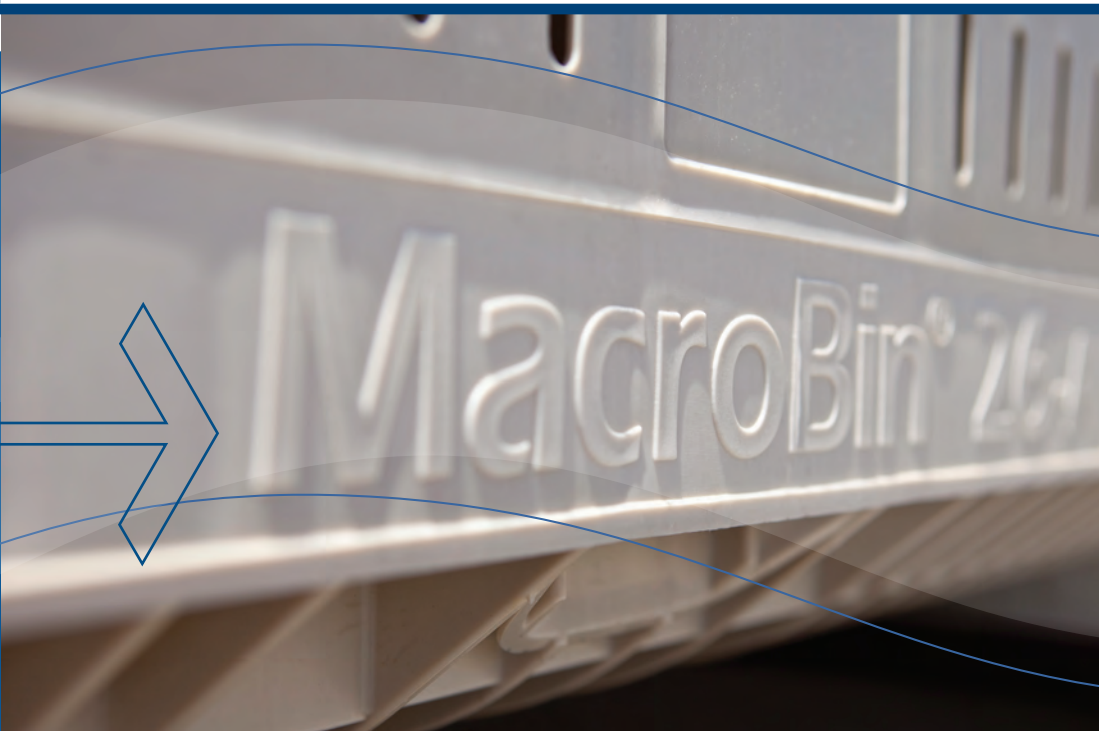
MacroBin® ファミリ 農業用